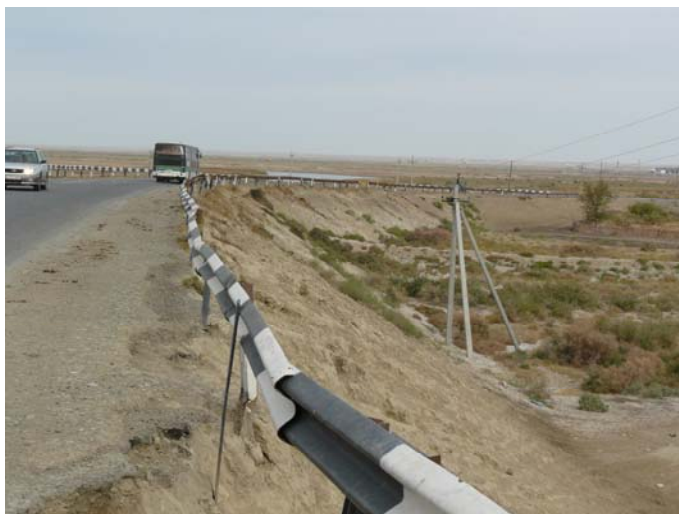
Фото 1 – Направление проектируемого спрямления

Также проектом предусматривается реконструкция существующих 3 мостов.